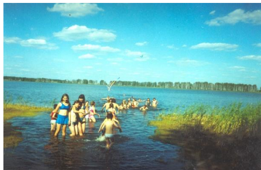
Купание в озере Горькое

Интересна история возникновения сада, тесно переплетающаяся с появлением детского санатория.