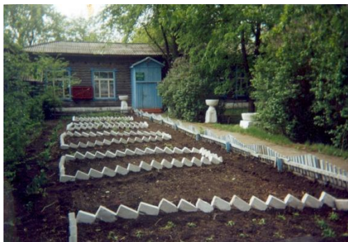
Двор детского санатория, окруженный дендросадом

Значимость : научная, историко-культурная.